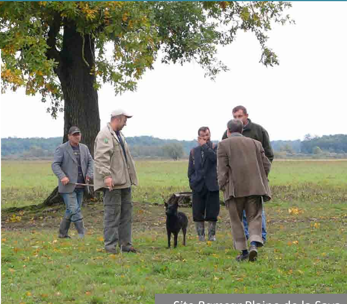
Site Ramsar Plaine de la Sava