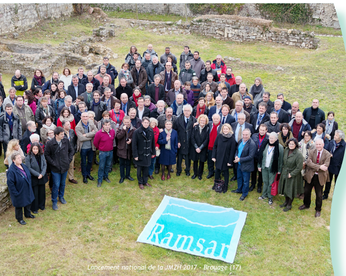
Lancement national de la JMZH 2017 - Brouage (17)

L'association Ramsar France a été créée en 2011 par les gestionnaires de sites Ramsar, pour créer un lien entre les réflexions et résolutions des pays signataires de la Convention de Ramsar, et les sites français désignés.