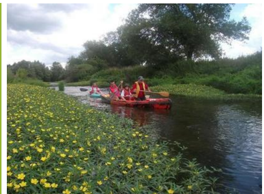
Randonnée en canoé sur le Cher.

Sur ce vaste sujet, l'agence nationale irlandaise des pêches intérieures ( Inland Fisheries Ireland, IFI ) chargée de la protection et de la gestion de la pêche a déjà réalisé d'importants efforts de communication vers les usagers, consultables ici .