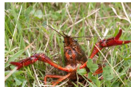
Ecrevisse de Louisiane.

Pour en savoir plus, visitez le site du GT IBMA et de la DREAL Auvergne et consultez les supports de présentation et d'identification des espèces, ou contactez David Happe , chargé de mission connaissance et conservation des espèces.