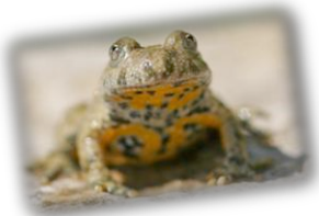
Sonneur à ventre jaune

« Nous allons enfin pouvoir montrer la complémentarité de l'agriculture et de la protection de l'environnement, car nous voulons mener à une agriculture durable et viable sur les territoires. »