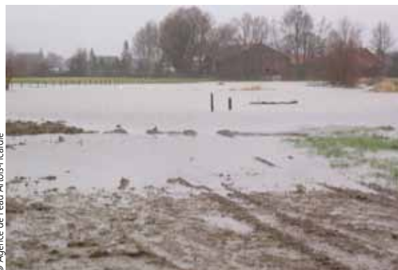
Vue de la frayère lors de la quinquennale de décembre 2012

Au total, trois hectares de terrain seront aménagés en comptant la frayère et les plantations en milieu terrestre.