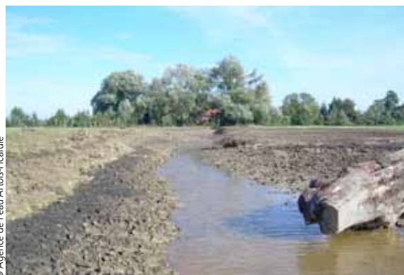
Création du chenal central au sein de l'annexe hydraulique rouverte. Octobre 2012