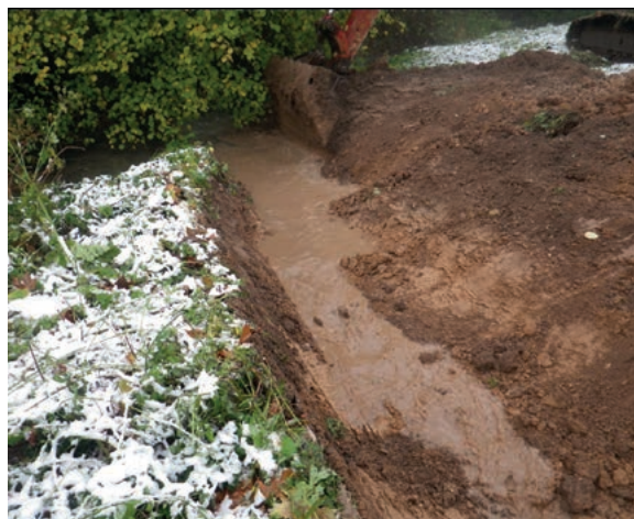
Bilal Ajouz, Ameva