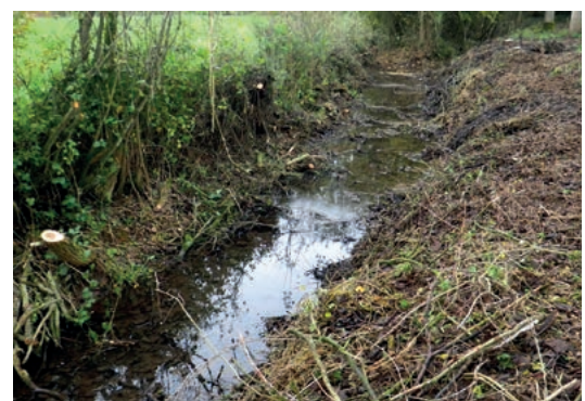
Le lit perché de la Poix entre les deux seuils, en 2013 avant travaux.