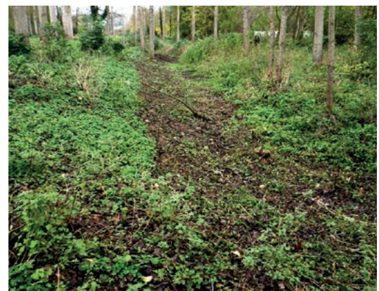
Le tracé encore visible du lit original en fond de vallée de la Poix, en 2013 avant travaux.