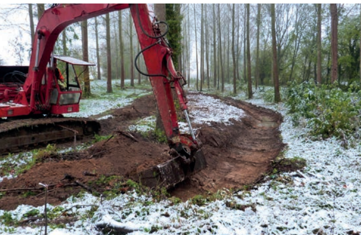
Bilal Ajouz, Ameva