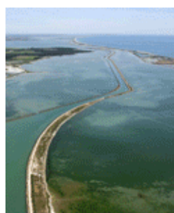
Etangs Palavasiens

Les milieux humides de France métropolitaine comme les tourbières, les landes, les prairies et forêts humides, les mares ou encore les marais asséchés et mouillés ... couvrent environ 1,8 millions d'hectares, soit 3% du territoire (hors vasières, milieux marins, cours d'eau et grands lacs). Les récifs coralliens, les mangroves, les herbiers marins et les milieux tourbeux sont parmi les milieux humides d'Outre-mer français les plus remarquables. La France avec près de 55 000 km 2 de coraux soit 10% des récifs coralliens mondiaux, a entre ses mains un capital inestimable.