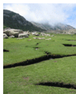
CCR Corse