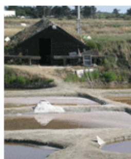
Maison salicole - Marais d'Olonnes.