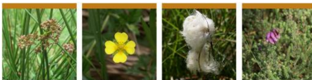
Juncus effusus (Juncus effusus), potentille dressée ( Potentilla erecta ), linagrette à feuille étroite ( Eriophorum angustifolium ), bruyère à quatre angles ( Erica tetralix )

Il précise aussi que les plantes hygrophiles indicatrices des zones humides sont répertoriées dans des listes établies par région biogéographique (Art. R. 211-108 du code de l'environnement).