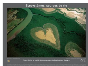
- L'eau, élément de vie