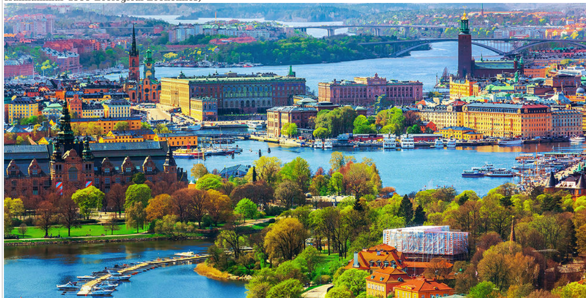
Les services locaux et directs générés par les écosystèmes urbains de la ville de Stockholm (source : Bolund & Hunhammar 1999 Ecological Economics)

La moitié de l'humanité, environ 4 milliards de personnes, vit aujourd'hui en zone urbaine. D'ici à 2050, 66% de la population mondiale, à la recherche d'emplois et d'une vie sociale dynamique, s'installera en ville. Les villes représentent environ 80% de la production économique mondiale. À mesure que les villes grandissent et que la demande de terres augmente, les zones humides reculent, se dégradent, sont comblées et finalement font place aux constructions. Or, si on les laisse intactes ou si on les restaure, les zones humides urbaines contribuent à rendre les villes agréables à vivre.