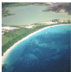
Etang des Salines