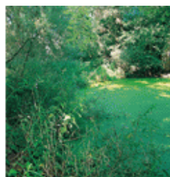
Les bords du Rhin