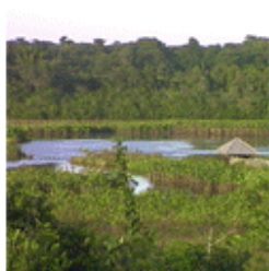
Estuaire du Sinnamary