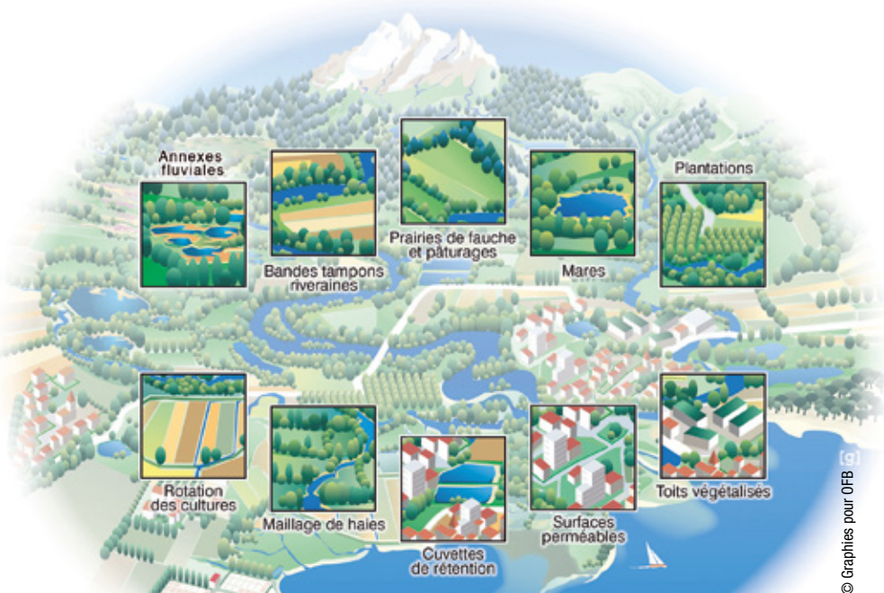
Exemples de mesures naturelles de rétention des eaux

Elles peuvent être généralisées à tous les types de contextes, agricoles, urbains,