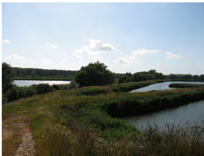
Vue d'ensemble des bassins