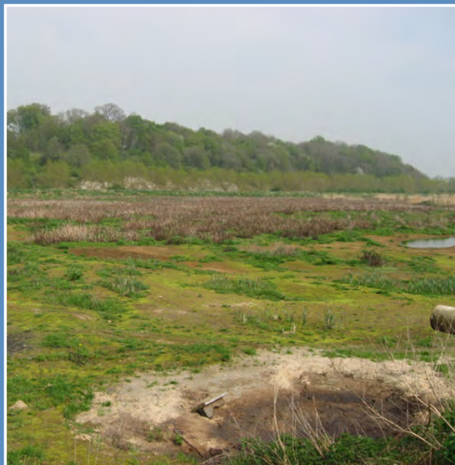
Ancien bassin atterrit

Le projet vise à assurer la protection foncière de 40 hectares de terres constitués de trois anciens bassins de la sucrerie. Ces bassins, situés en périphérie de la commune de Grand-Laviers entre le canal de la Somme et la ligne ferroviaire Paris-Calais, s'intègrent à une zone humide comprenant sept bassins d'eau, des pâturages humides, un réseau de fossés larges, une roselière jouxtant deux mares, une peupleraie* et une parcelle cultivée. De très nombreuses espèces et habitats d'intérêt national et européen sont présents. Ces bassins en basse vallée de la Somme sont d'un intérêt faunistique majeur.