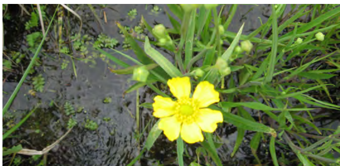
Grande Douve ( Ranunculus lingua )