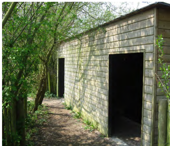
Sentier des saules têtards (observatoire)

Des aménagements permettent en outre l'observation de la flore et de la faune, avifaune notamment (observatoires).