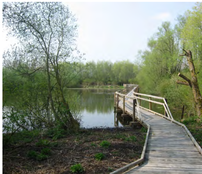
Sentier des saules têtards (sentier en platelage)

Cependant il n'est pas prévu d'effectuer sur les sites considérés les mêmes opérations du fait de la fragilité du milieu et du manque d'accessibilité.