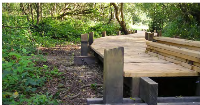
Aménagement du sentier

Les travaux ont démarré le 5 décembre 2005 et se sont achevés le 30 juin 2008. Ils ont été réalisés sur plusieurs années pour permettre à la commune de Condette d'étaler les dépenses dans le temps. Des réunions de chantier ont été organisées tout au long des travaux par l'assistant à maîtrise d'œuvre. Dans le cadre de cette réalisation, un comité technique des experts du handicap a également été mis en place pour valider les différents éléments de finition.