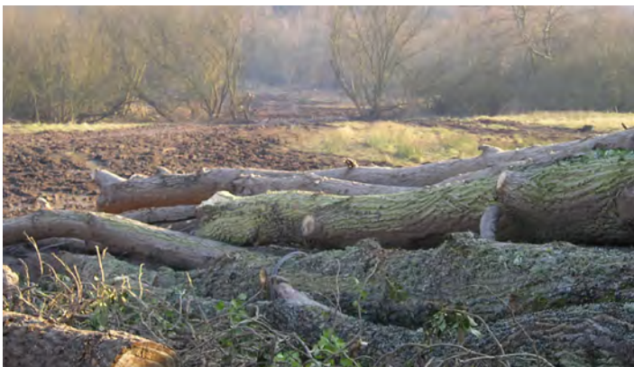
Coupe de peupliers

Abandonné par toute activité agricole depuis les années 60, le marais de Condette s'est notablement modifié. La restauration de ce patrimoine a nécessité l'abattage de peupliers, de bouquets de saules et d'aulnes. La zone humide a également été réaménagée : reprofilage des berges de mares, création d'un fossé de ceinture, divers travaux de génie écologique.