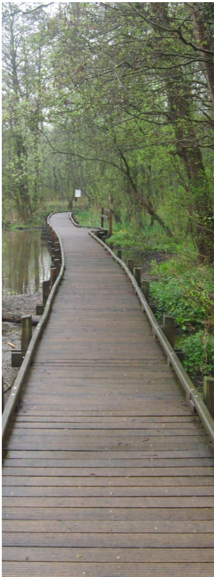
Platelage en bois

En secteurs humides, un sentier en platelage bois avec planches rainurées et chasse-roue d'une largeur de 1,30 m en section courante avec des surlargeurs en 2,22 m.