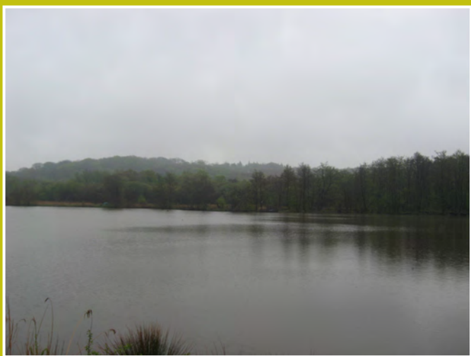
Étang de Condette