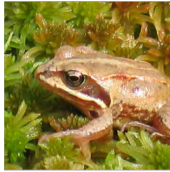
Grenouille des champs ( Rana arvalis )

Dans le cadre de ce projet, un comité technique a été mis en place pour suivre les travaux. Ce comité de suivi est composé de la commune, des partenaires financiers et techniques du parc.