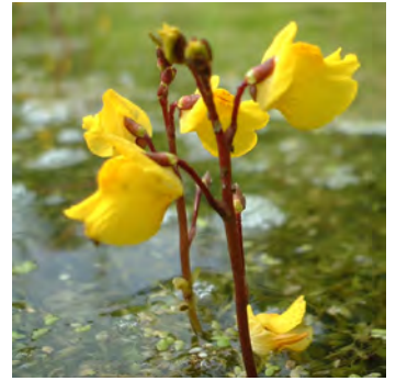
Utriculaire citrine ( Utricularia australis )