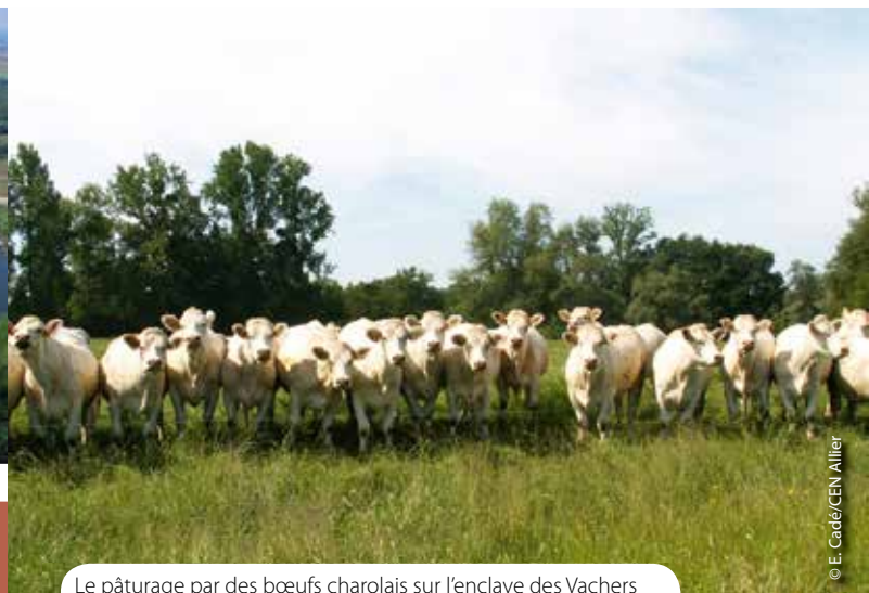
Le pâturage par des bœufs charolais sur l'enclave des Vachers est encadré par un bail rural à clauses environnementales.

électriques et que l'apport d'azote soit interdit. Mais même lorsque celui-ci était autorisé, je n'y avais pas recours tous les ans.