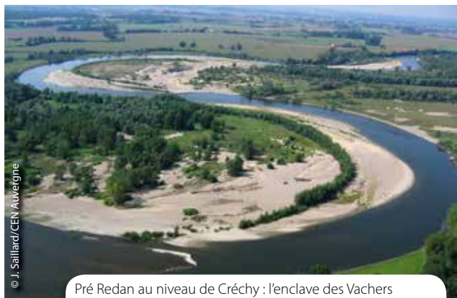
Pré Redan au niveau de Créchy : l'enclave des Vachers est la prairie visible à droite, au-dessus du premier méandre.

Ce contrat permet ainsi de pérenniser une gestion agricole durable adaptée aux aléas d'érosion et favorable à la biodiversité et à la ressource en eau.