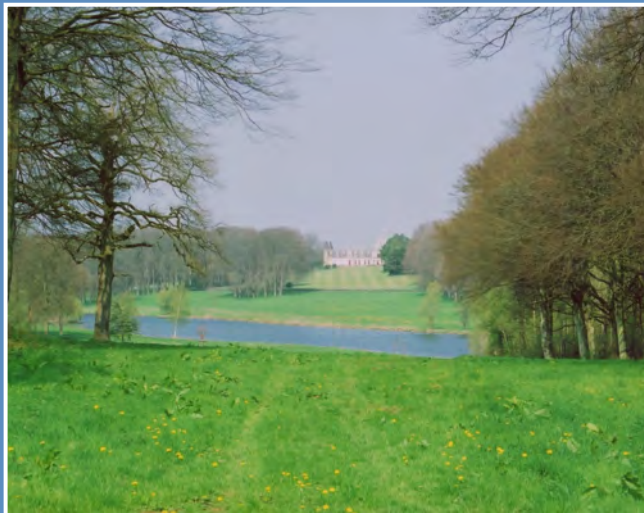
Domaine de Régnière-Écluse

Afin de soustraire ce domaine d'un risque important de parcelisation et de démembrement, le CELRL* en assure la maîtrise foncière.