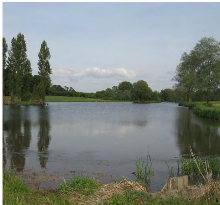
Étang du bas parc