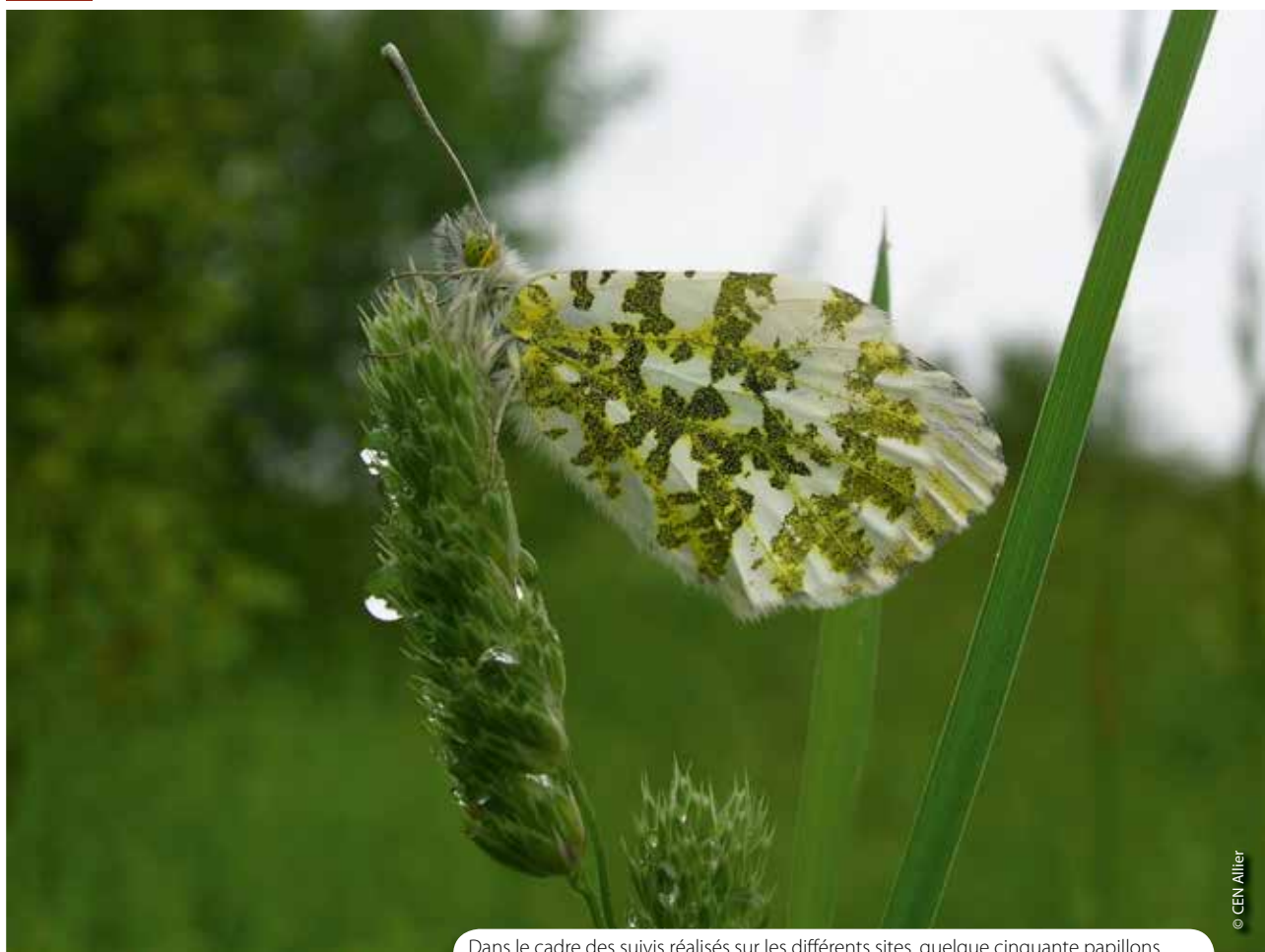
Dans le cadre des suivis réalisés sur les différents sites, quelque cinquante papillons de jour ont été recensés. Ici une aurore ( Anthocharis cardamines ).