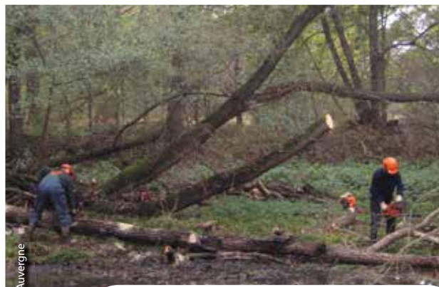
L'enlèvement d'encombres fait partie de l'entretien courant pour préserver la mobilité des cours d'eau. Ici dans un bras mort du secteur de Précaillé.