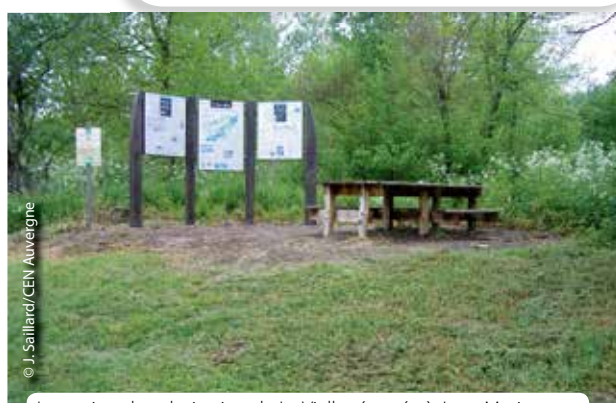
La station de valorisation de La Vialle rénovée à Joze-Maringues.