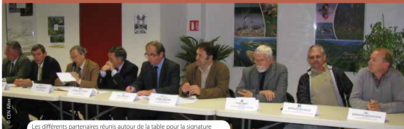
Les différents partenaires réunis autour de la table pour la signature du contrat nature Val d'Allier en octobre 2008.

- Le site de la Boire des Carrés est un autre espace naturel sensible du département de l'Allier. Les 200 hectares, appartenant presque entièrement au Domaine public fluvial, sont gérés par la Communauté d'agglomération Vichy Val d'Allier qui s'appuie sur un plan de gestion dont elle a confié la mise en œuvre à la LPO Auvergne en 2007 pour cinq ans. Situé dans un territoire fortement peuplé, l'aménagement du site pour le grand public est apparu primordial. En 2008, deux parcours de découverte nature ont été réalisés. Ils sont parmi les premiers en Auvergne à viser une accessibilité aux quatre types de handicap (moteur, visuel, auditif et mental) : des aménagements spécifiques ont été expérimentés, des documents complémentaires ont été produits, les panneaux d'interprétation ont été adaptés et un système d'audioguidage par GPS a été mis en place.