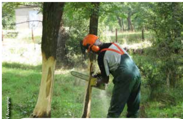
L'écorçage des robiniers est une technique mise en œuvre pour réduire l'emprise de cette espèce exotique envahissante sur le site de Précaillé.