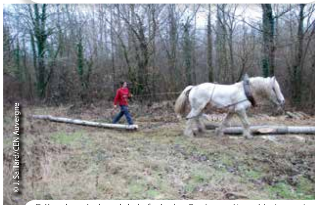
Débardage à cheval de la forêt des Couleyres (Joze-Maringues), avant replantation en forêt alluviale à bois dur.