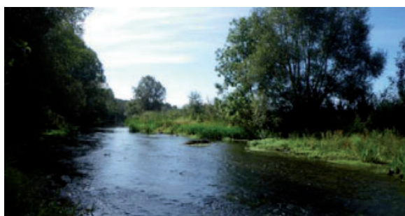
Retour d'écoulements rapides sur la zone amont de l'ancien déversoir. Août 2011