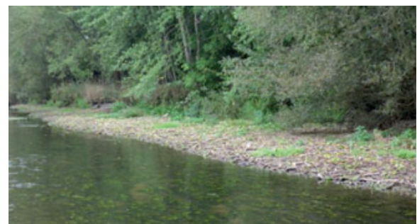
Retalutage naturel des berges. Août 2011

Toutefois, les travaux étant récents, il n'est pas surprenant que les effets de l'effacement sur la faune aquatique demeurent assez minimes.