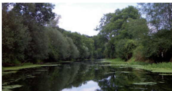
Écoulements lenticulaires avant effacement, en amont de la retenue du déversoir. Juillet 2009

Par ailleurs, la commune d'Hatrizé souhaite mettre en place des animations sur le site lors d'événements annuels (fête nationale...).