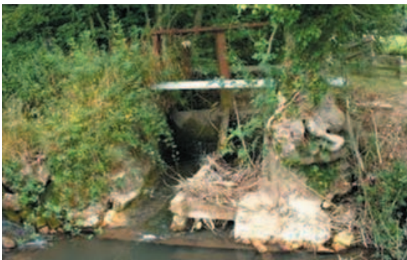
Syndicat mixte pour le SAGE de la Canche