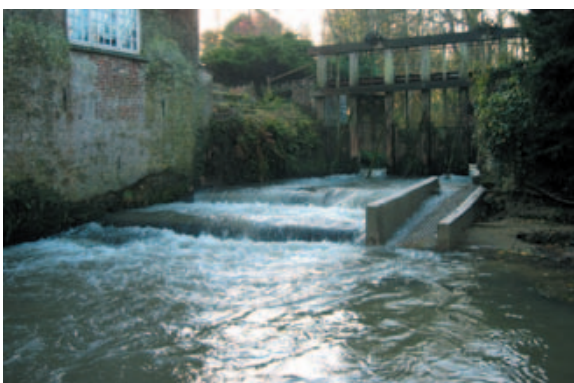
Syndicat mixte pour le SAGE de la Canche