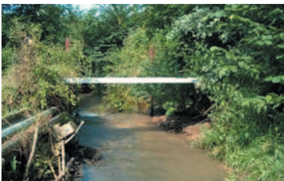
Syndicat mixte pour le SAGE de la Canche