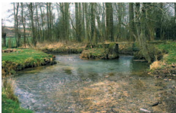
Syndicat mixte pour le SAGE de la Canche

Un seuil sur la Créquoise à Lebiez, avant (en haut) et après (en bas) restauration du lit de la rivière. Après restauration, le seuil redevient franchissable pour les truites, anguilles et lamproies.