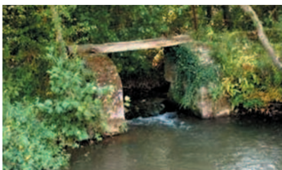
Syndicat mixte pour le SAGE de la Canche