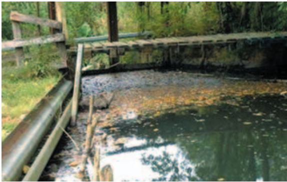
Syndicat mixte pour le SAGE de la Canche