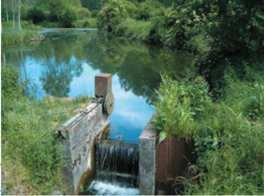
Sylvain Royet - SIAC