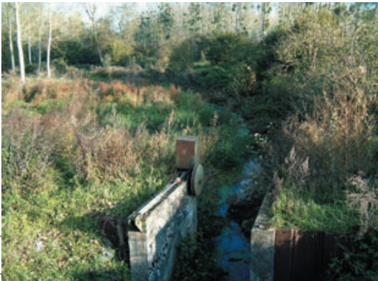
Sylvain Royet - SIAC