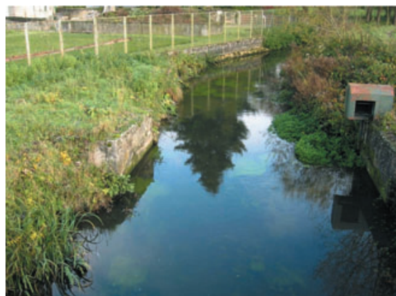
Sylvain Royet - SIAC