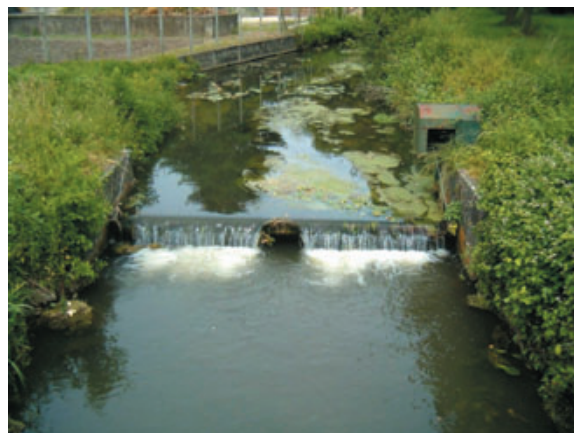
Sylvain Royet - SIAC

Le cours d'eau s'est désensasé et les phénomènes visuels dus à l'eutrophisation d'eutrophisation ont disparu.