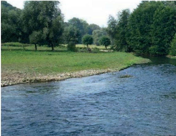
La prairie après restauration de la zone humide [2014].

le détournement du ruisseau des Courtieux hors des installations industrielles et la création d'une zone humide dans la prairie face au site. L'entreprise SCA Tissue décide de porter ce projet, bénéfique économiquement pour l'exploitation du site et conforme à ses valeurs, en termes de respect de l'environnement.