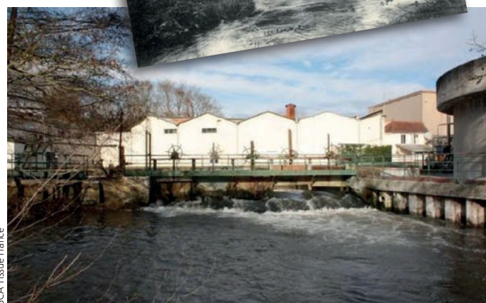
L'ouvrage des Plis en 2014.