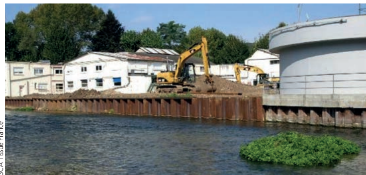
Comblement du bras usinier après suppression de l'ouvrage des Plis [2014].

Un an après les travaux, les expertises hydromorphologiques menées sur l'Iton, à l'emplacement de l'ancien ouvrage des Plis, mettent en évidence une modification du profil en long de la rivière, avec un abaissement de la ligne d'eau de 25 cm sur l'amont et une rehausse de 20 à 30 cm sur l'aval. D'un point de vue économique et sécuritaire, ces travaux sont bénéfiques pour SCA Tissue France, qui est parvenu à séparer la rivière de ses installations industrielles tout en supprimant les contraintes d'entretien. Le risque de pollution accidentelle des eaux est réduit grâce à la remise en fond de talweg du ruisseau des Courtieux et au comblement du bief.