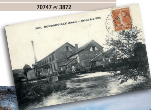
L'usine des Plis vers 1910.